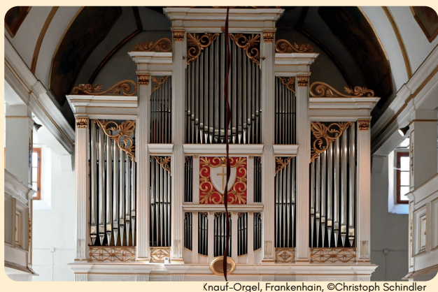
Knauf-Organ, Frankenhain